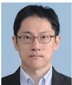
「業績賞を受賞して」

最後になりますが、選考に携わられた委員の先生方、ならびに日頃より研究・教育環境を支えてくださる関係各位に深く感謝申し上げます。今後とも変わらぬご指導ご鞭撻を賜りますよう、何卒よろしくお願い申し上げます。