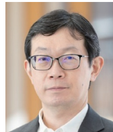
「部門一般表彰（国際貢献部門）を受賞して」